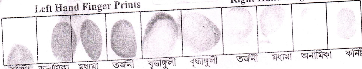
Right Hand Finger Prints