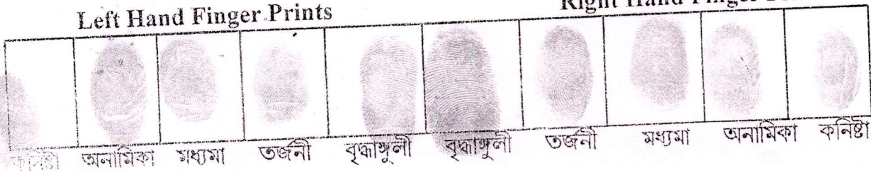
Right Hand Finger Prints